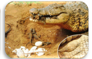
Le bébé crocodile casse sa coquille grâce à une pointe, la « dent de l'œuf », qu'il possède sur son museau et la maman les transporte à la rivière.